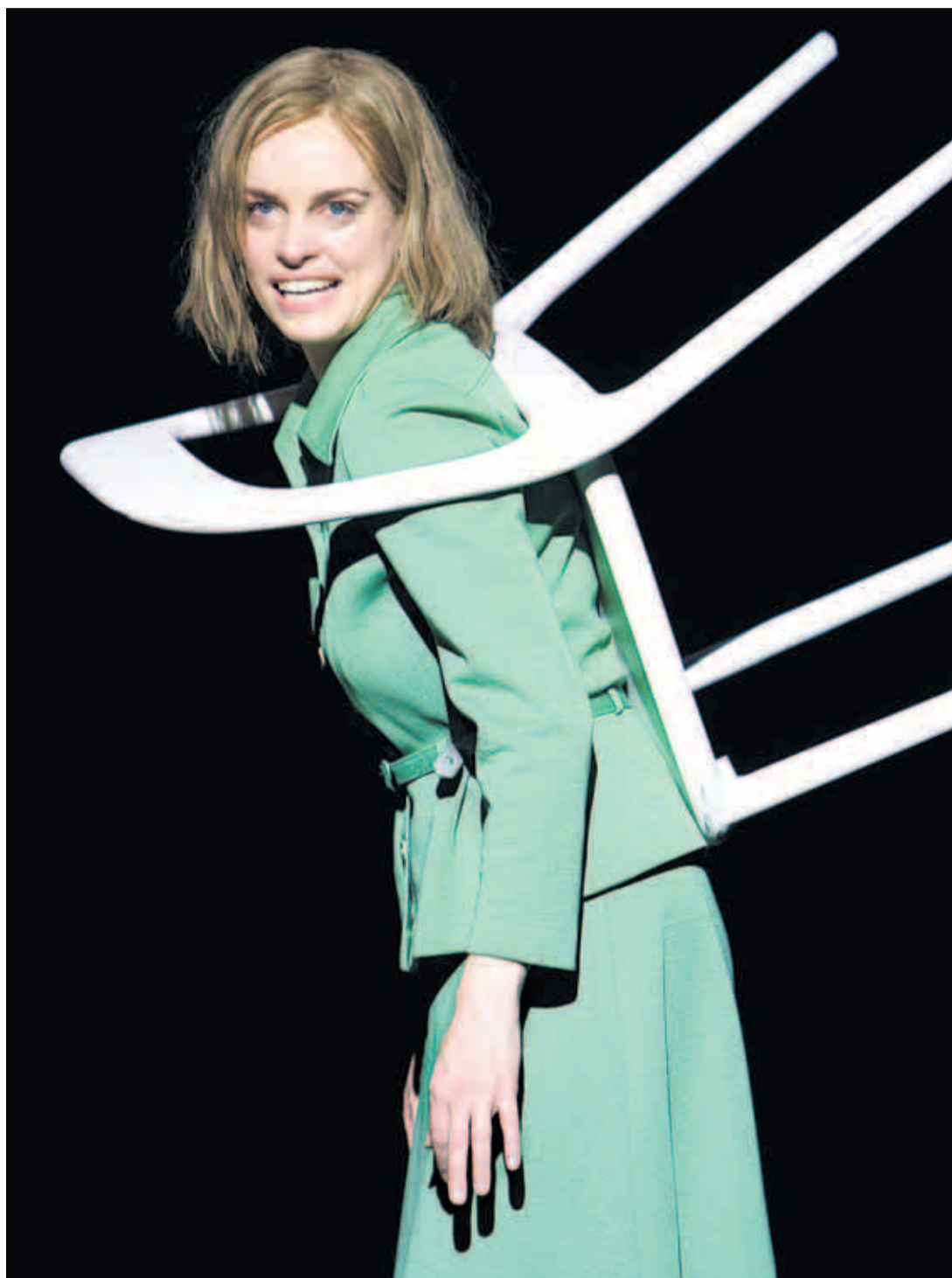
Nina Hoss spielt die Hauptrolle der Lotte in „Groß und klein“